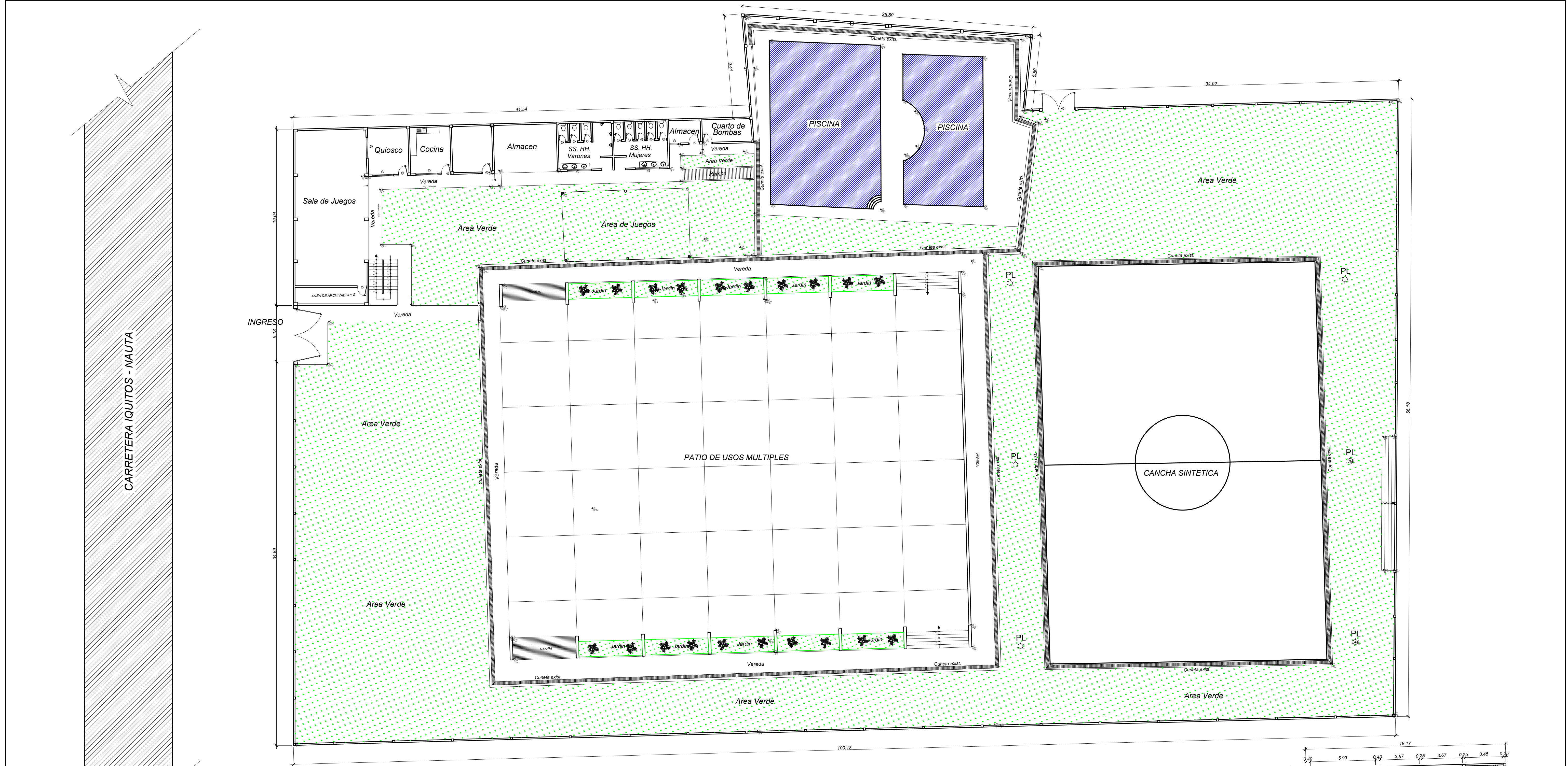
PLANTA DISTRIBUCION - EDIFICACION EXISTENTE 1er PISO ESC: 1/175